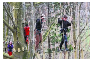
TXINDOKIKO ITZALA – PARQUE DE AVENTURA Abaltzisketa