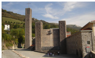
SANTUARIO ARANTZAZU Oñati