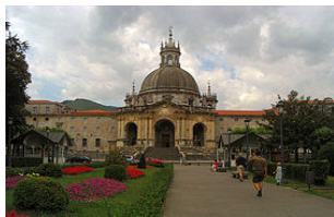
BASÍLICA SAN IGNACIO DE LOYOLA Azpeitia