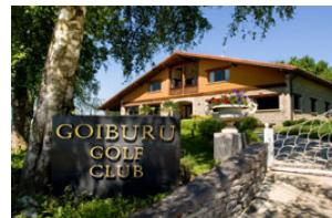
GOIBURU GOLF CLUB Andoain